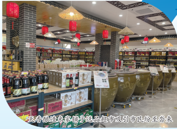
天香酿造东昌府区调味品超市吸引市民纷至沓来

园区广大投资者、建设者、管理服务者齐心协力,园区营商环境持续优化,推动园区经济实现高质量发展。