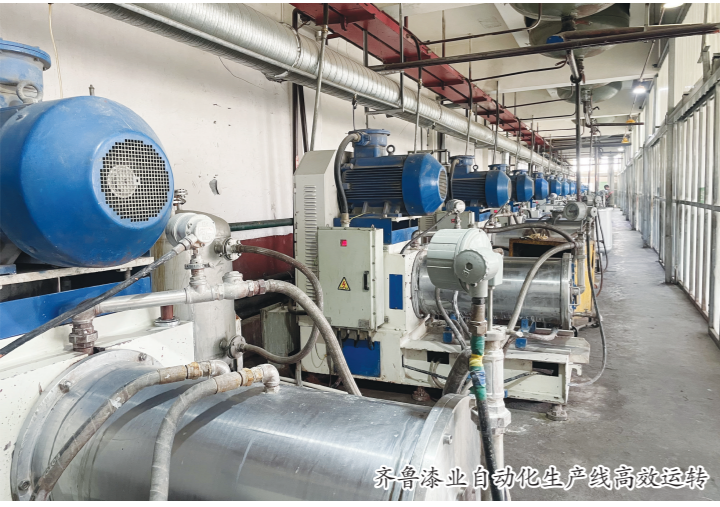
齐鲁漆业自动化生产线高效运转

中泰药业、莱鑫公司是东昌府区大力实施创新驱动发展战略的典型例证。嘉明经济开发区先后出台加快科技创新的一系列措施,主动引导和推动新技术、新成果向战略性新兴产业集聚,扶持有优势、有潜力、有产业链的重点行业转型,重点扶持天工岩土、天开铝业、莱鑫超硬材料、鑫科生物等科技型企业,培育发展新材料、新能源、生物医药、节能环保等新兴产业,支持暖频道服饰、天工岩土工具等产品争创省级名牌。在科技创新的引领下,聊城市创新驱动发展跑出了“加速度”。