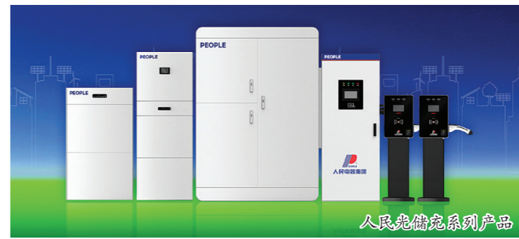
人民电器智能系列产品

北斗5G半导体研究院、国际欧亚科学院人民院士专家服务中心、金融研究院”五大研究院。 在2023年中国500最具价值品牌发布会上,人民控股集团的“人民”品牌,以788.15亿元再次强势上榜。