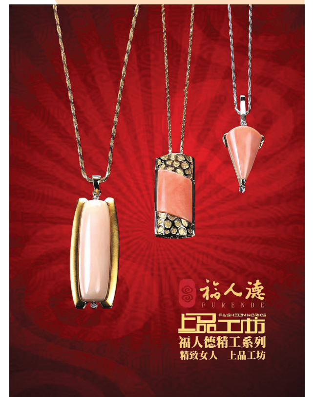
福人德 FURENDE FASHION JEWELRY 福人德精工系列 精致女人 上品工坊