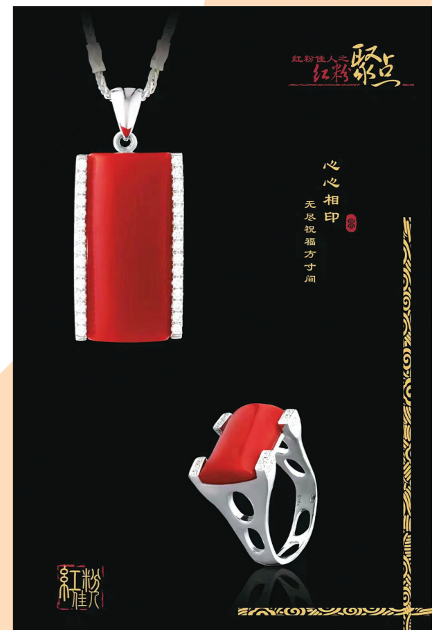
心心相印 无尽祝福千万