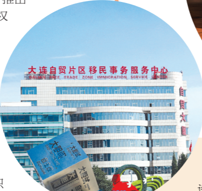
大连金普新区国际人才港暨RCEP大连自贸片区国际人才港和大连自贸片区移民事务服务中心揭牌启用