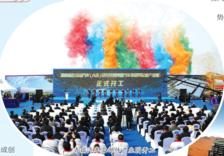
奇瑞汽车大连工厂生产的新能源汽车