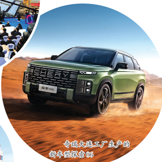
奇瑞大连工厂生产的新能源汽车