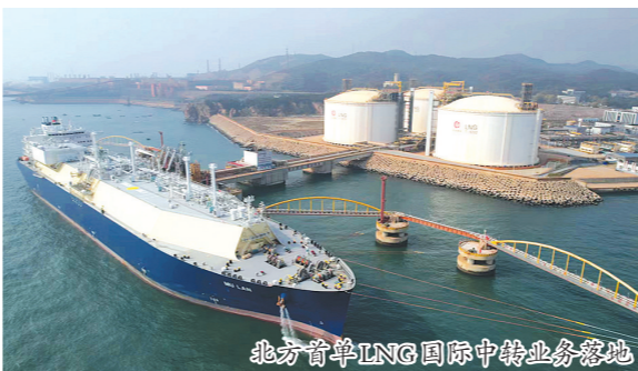
北方首单LNG国际中转业务落地

拓展大宗商品贸易新模式,用“小切口”解决“大问题”的经典案例。通过赋予LNG接收站保税功能,实现了从一般贸易到保税贸易的转变,推动原有贸易模式从“山穷水尽”到“柳暗花明”,也为下一步拓展进口大豆、铜精矿等大宗商品国际贸易多元化发展,提供了成熟可行的经验借鉴。