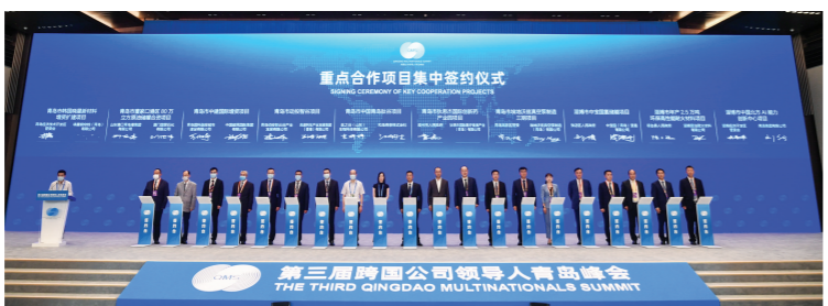
第三届跨国公司领导人青岛峰会集中签约

为更好地推动外贸发展,山东积极化解外贸难点堵点。2020年至今,坚持多措并举为企业纾困,上线运行“稳外贸稳外资服务平台”,覆盖企业32000余家,截至目前“一企一策”解决企业诉求2792个。今年以来,围绕外贸企业经营中遇到的融资难等问题,出台《外贸固稳提质2022年行动计划》,提出32条稳外贸政策措施。创新推出“齐鲁进口贷”等政策,推动外贸稳定增长。全省外贸进出口去年达到2.9万亿元,今年前8个月,实现2.18万亿元,同比增长18.2%,进出口、出口及进口增速3项指标跑赢全国。