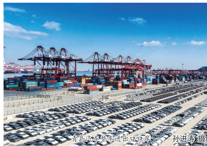
青岛汽车整车进出口口岸

据了解,今年以来,山东研究制定了《传统消费升级行动》《新兴消费扩容行动》方案,提出32条务实措施。深化城乡高效