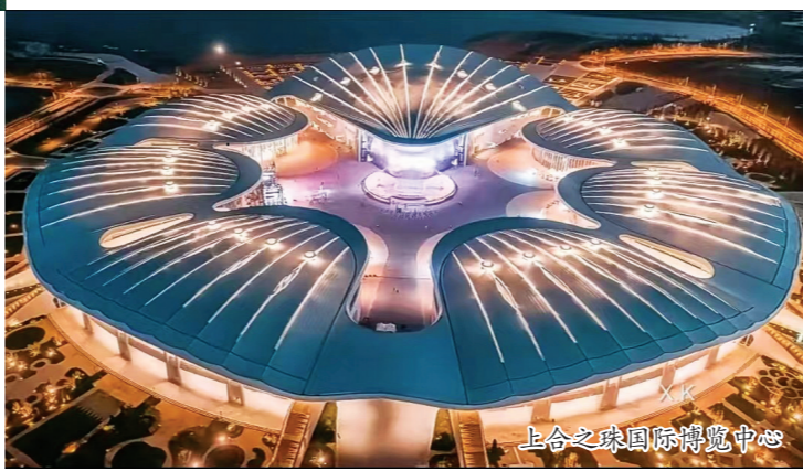
上合之珠国际博览中心

在平台增强自身吸引力的同时,山东还强化外资保障力度,进一步优化营商环境,提升引资软实力。对标国际高标准贸易投资规则,2020年以来,山东省先后出台“稳外贸稳外资政策清单32条”“高水平利用外资20条”“重点外资项目要素保障机制、鼓励跨国公司在山东设立地区总部办法、推进合格境外有限合伙人(QFLP)试点和金融业利用外资政策措施等一系列政策,引导外资企业外债转增注册资本等政策措施纳入稳中求进高质量发展政策清单,营商环境进一步优化。