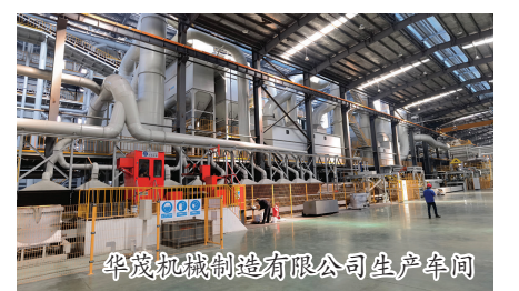
华菱机械制造有限公司生产车间

据了解,今年以来,郎溪经开区结合安徽省、宣城市以及郎溪县开展“新春访万企、助力解难题”“优环境、稳经济”活