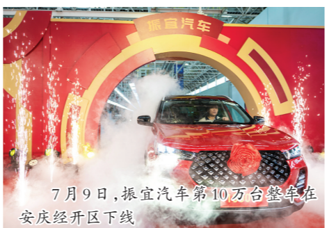
7月9日,振宜汽车第10万台整车在安庆经开区下线

据了解,安庆经开区行政审批局承接市场监管、发改、规划、住建、人防、水利和环保等38项行政审批事项,招商引资项目从企业开办到工程竣工在园区可基本实现闭环办理,真正实现“一枚印章管审批”。安庆经开区还全面推进“标准