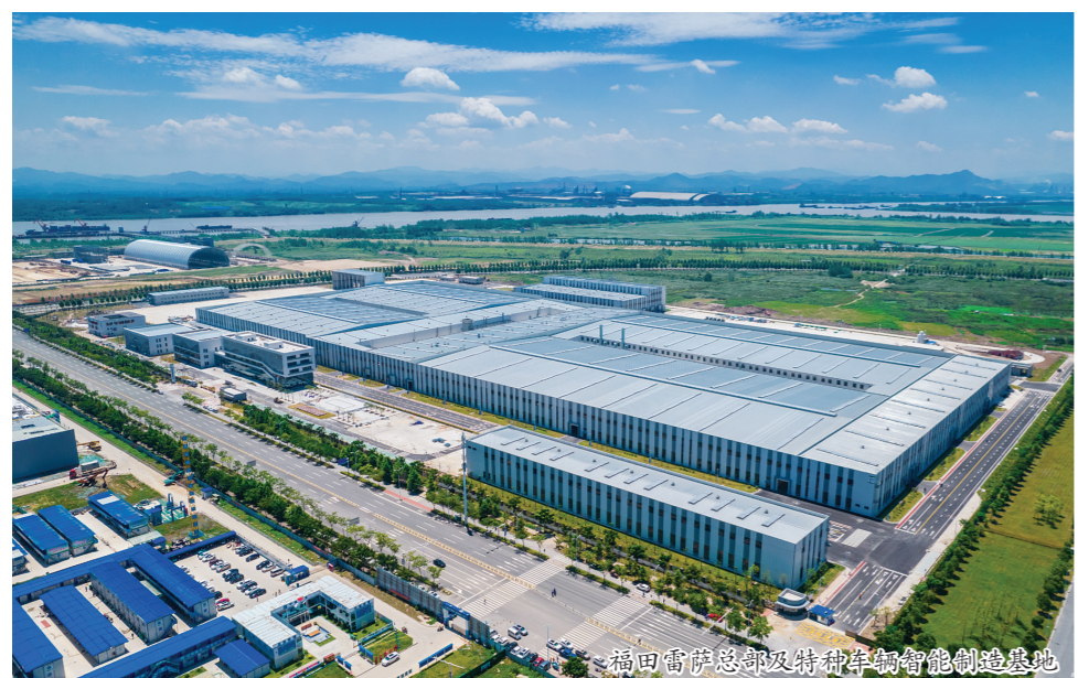
福田雷萨总部及特种车辆智能制造基地

三十岁意味着成熟、意味着责任。三十而立向未来,锚定目标再出发……在安庆市“进百强、上台阶”的重大战略机遇期,安庆经开区踔厉奋发、笃行不怠,努力朝着“创一流、进十强、过千亿”发展目标迈进!