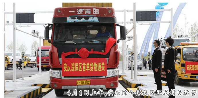
4月1日上午,安庆综合保税区正式封关运营

制综保区产业规划,安庆经开区将最大限度发挥综合保税区与安徽自贸试验区联动创新区的制度创新优势和优惠政策叠加优势,进一步提升开放能级,力争到2025年,把综合保税区建设成为安徽省产业创新发展基地和开放高地,到2030年成为长江中下游地区有重要影响力的海关特殊监管区。